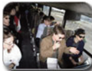
The Center for Land Use Interpretation Post Consumed: The Landscape of Waste in Los Angeles, 2008 (left) Highway 62 Field Trip and Tour, 2007 (right)