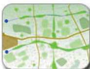
Gans Studio House with Roll Out Core (left) Camp Plan (right) 2008