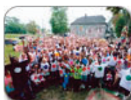
The Heidelberg Project Detroit, Michigan, 1987-present