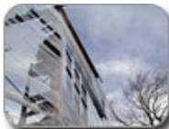
Detroit Collaborative Design Center Hay House, Detroit, Michigan, 2001 (left) House Wrap, Detroit, Michigan, 2004 (right)