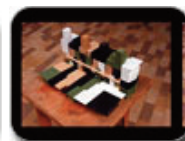
Smith and Others The Essex (left) The Essex, reconfigurable development tool (right) San Diego, 2002