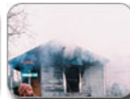
Project Row Houses Houston, Texas, 2003-Present