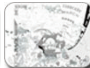
Rebar Panhandle Bandshell Flyout San Francisco, California, 2008