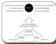
Estudio Teddy Cruz 60 linear mile section, San Diego/Tijuana, 2008 (left) Expanded model of architectural practice and research, 2008 (right)