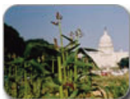
The Edible Schoolyard/ Yale Sustainable Food Project King Middle School in Berkeley, California (left) Model schoolyard garden, Washington DC National Mall, 2006 (right)