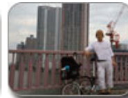
International Center for Urban Ecology The New Silk Road (courtesy of Kyong Park), 2008