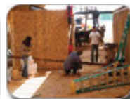
Rural Studio at Auburn University Hale County Animal Shelter, Alabama, 2006