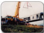
Design Corps Migrant Bath House Prototype, Sampson County, North Carolina, 2003 (left) Migrant Farmworker Housing, Adams County, Pennsylvania, 2003 (right)