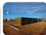
Studio 804 Sustainable Prototype Arts Center Greensburg, Kansas, 2008